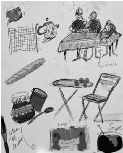
Fig.1: Sketch of the socio-materiality of practice in Solidarity Breakfast

Sketching the initiative's everyday enactments of home, with its additions, absences and movement revealed how homing was transformed and compromised with. The recent addition of a bowl of soup to the traditional French breakfast menu was a response to how exiles rapidly became hungry because of a mainly sweet menu imitating traditional breakfast in French homes yet not ideal for migrant newcomers living in the streets and in camps who sometimes only eat once a day. It was also stirred up when attendees disliked the food because of differences in taste and conceptions of homely food. Questions like “Whose home should we enact” and “Do our guests feel at home?” came up regularly and were responded to through socio-material adjustments. In another incidence, knives – after being used for preparation – were removed from the main distribution table in fear that this could lead to harm to self and others, considering the context of exile and deteriorated mental health in the borderlands. Homing was thereby brought back into movement and multiplied, weaved into the borderland, transformed by other conceptions of homeliness forcing shifts in what homing should and could be in that context.