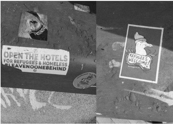
Fig.7. Stickers from one of the places in Flensburg where homeless people usually hang out during the day