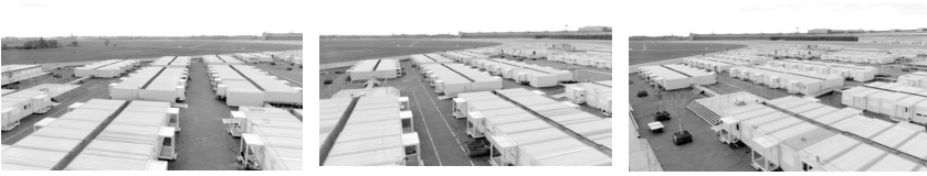
Fig.5. Moving the static: Drone orbits the immovable container homes “still(s) from the film 13 Square Meters, directed by Kamil Bembnista & Ayham Dalal; courtesy of SFB 1265 Re-Figuration of Spaces.”