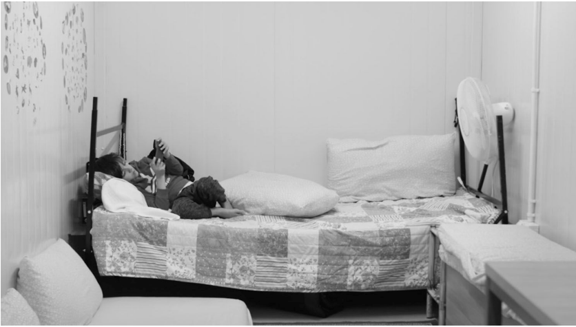
Fig.3. Scene home on the move: a young boy trying to adapt in his temporary shelter "still(s) from the film 13 Square Meters, directed by Kamil Bembnista & Ayham Dalal; courtesy of SFB 1265 Re-Figuration of Spaces."