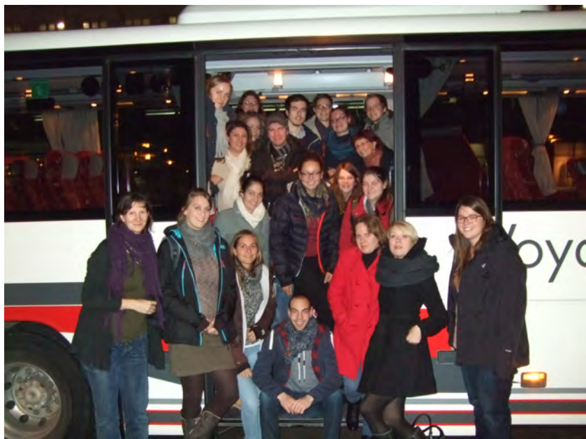
Die Studierenden und Dozentinnen des Seminars auf Exkursion, 16.11.2013.