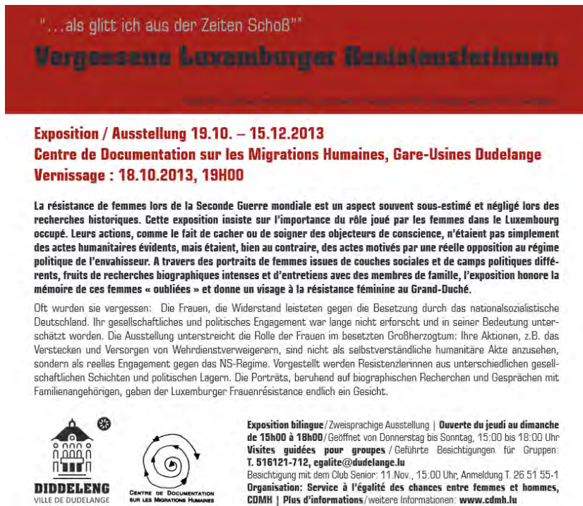
Abbildung 2: Flyer zur Ausstellung (Rückseite)

Das Medium der Ausstellung hat den Anspruch, im Gegensatz zu einer wissenschaftlichen Publikation die sich an ein Forschungspublikum richtet, einer breiten Masse Zugang zu einem historischen Sachverhalt zu ermöglichen bzw. soll helfen, die Vergangenheit zu verstehen, sich zu orientieren und sich zu identifizieren. Die nachfolgende Analyse wird zeigen, dass die historische Aufarbeitung des Widerstands in der Ausstellung „Vergessene Luxemburger Resistenzlerinnen“ zugunsten einer biografischen und schicksalsorientierten Darstellung der Frauen in den Hintergrund tritt. Es wird zu klären sein, ob die Ausstellung ihrem auf der Einleitungstafel formulierten Anspruch, an Frauen in der Resistenz exemplarisch zu erinnern, gerecht wird oder eher die Geschichte einer – rein quantitativ betrachtet – kleinen Minderheit rekonstruiert (vgl. Wehenkel 1985; Dostert 1995; Jemming 1997). Weiterhin stellt sich die Frage, inwiefern sich heutige politische Forderungen nach mehr