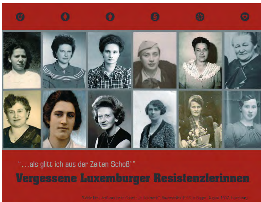
Abbildung 1: Flyer zur Ausstellung (Vorderseite).

Exposition / Ausstellung 19.10. – 15.12.2013