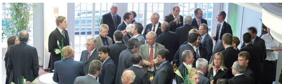
Wissenschaft und Wirtschaft im Dialog: reger Meinungsaustausch in der Aula der Universität

Nicht zufällig zierte das INM in seiner Jubiläumswoche auch den Titel einer Sonderveröffentlichung der Saarbrücker Zeitung („Zukunftsland Saarland“). In dieser Beilage ging es unter anderem um die stärkere Verzahnung von Wissenschaft und Wirtschaft. Dieses Thema beherrschte auch viele Gespräche, die beim Get-together nach dem