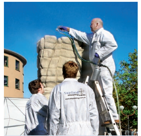
Drei Männer mit Spritzpistole am Illinger Marktplatz-Brunnen

Auf den ersten Blick sieht er aus wie Brunnen halt aussehen. Aber er hat doch etwas Besonderes. Der Illinger Marktplatz-Brunnen wird neuerdings durch eine spezielle Beschichtung vor Schmutz und Graffiti geschützt. Die Idee dazu hatte die Initiative „Saarland Empowering Nano“, zu deren Initiatoren auch das INM gehört. Sie will mit solchen Aktionen zeigen, wie stark Nanotechnologie bereits im Alltag verankert ist.